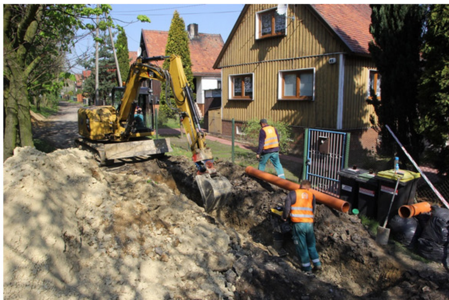
Budowa sieci kanalizacyjnej i wodociągowej w Klimontowie

3 miliony złotych będzie kosztować miasto budowa sieci kanalizacyjnej i wodociągowej w Klimontowie. W pierwszej kolejności prace zostaną wykonane na ulicy Wróblewskiego oraz Dobrzańskiego.