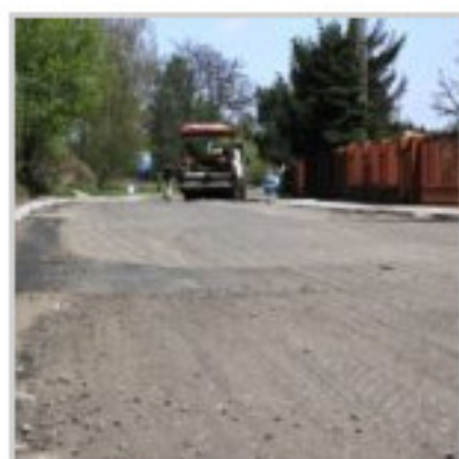
Budowa sieci kanalizacyjnej i wodociągowej w Klimontowie –