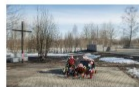
Czas wspomnień i zadumy. Ósma rocznica tragedii smoleńskiej [RELACJA]