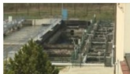
Oczyszczalnia ścieków po modernizacji

Ponadto przedsiębiorstwo używa do czyszczenia kanalizacji pojazdów zakupionych w 2003 r. za 1,3 mln zł i w 2006 r. za 1,4 mln zł. Najstarszym pojazdem, który powoli kończy służbę, jest 20-letni jeczc, wykorzystywany głównie do udrażniania sieci kanalizacyjnych o niewielkich średnicach.