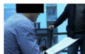
Wirtualne inwestycje, realne oszustwo. CBŚP na tropie afery FOREX