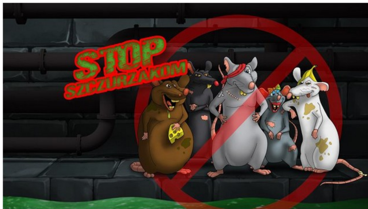
Gang Szczurzaków (Materiały promocyjne)